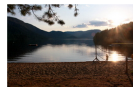
Gegen 18.30 Uhr kamen wir auf den

Zwischendurch fanden wir durch unser liebes Navi noch einen Remi (Supermarkt), wo wir unsere Vorräte auffrischten, und dann ging es ganz gewagt durch die Botanik auf engen Strassen, dank Navi, bis wir wieder auf unserer Hauptstrasse entlang eines Sees bis nach Bö kamen. Die Gegend wurde aber immer schöner, die Berge immer höher, leider aber auch die Strassen immer kurviger.